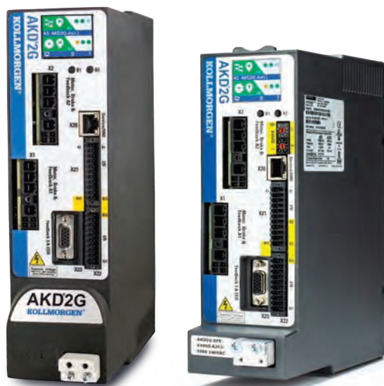
双轴AKD2G 480 Vac (图示带选配的反馈和I/O扩展)

扩展I/O型号可选配SMM。SMM可将某些I/O转换为“安全”I/O，并使驱动器能够与FsoE主机安全连接。同样，这些型号的外形尺寸也与基础型号相同。